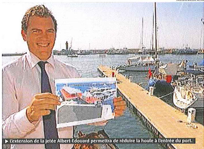
► L'extension de la jetée Albert-Edouard permettra de réduire la houle à l'entrée du port.