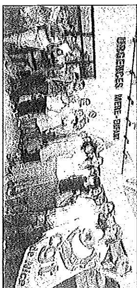
Usagers, salariés du CHU et de Lernal étaient réunis hier autour d'un apéro géant d'adieu devant les urgences de l'Archet.