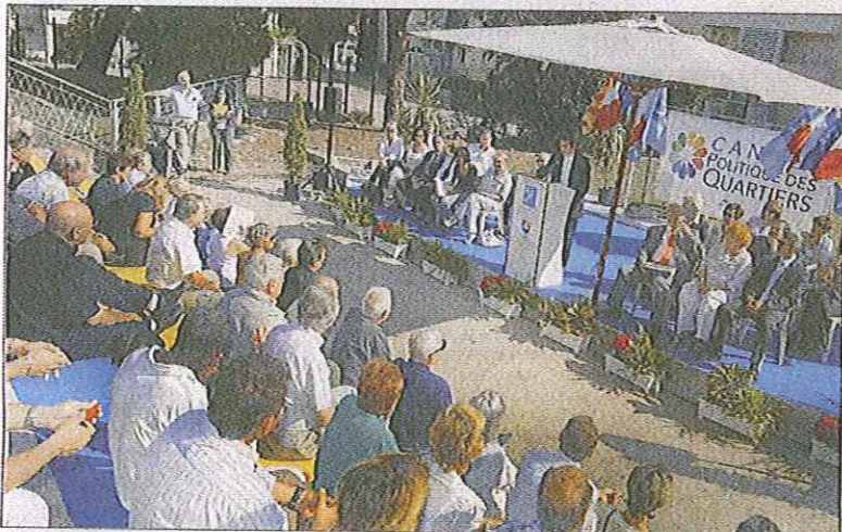
Un an après sa présentation officielle, les élus ont fait le point au Riou sur leur action en faveur des quartiers.