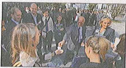
Eco-Biz : un forum comptant 600 inscrits et destiné à faciliter les mises en relation entre les professionnels des A.-M.

Mais qui étaient ces personnes, en costumes et tailleurs, regroupées hier matin en rond par groupes de dix dans la cour de la Chambre de commerce ? C'étaient les participants au 2 e forum Eco-Biz organisé par l'organisme consulaire pour faciliter les mises en relation entre les professionnels des A.-M. Cadres, chefs d'entreprises, recruteurs... La journée s'est déroulée à la manière d'un speed dating.