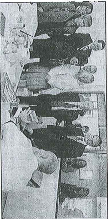
Les élus se sont longuement arrêtés sur les infrastructures novatrices réalisées à l'Edelweiss, notamment les salles de jeux et la balnéothérapie.

financement. Notamment, grâce à une subvention exceptionnelle de deux millions d'euros et une caution d'emprunt conjointe avec la ville. « C'est ici une réalisation qui n'entre pas dans nos compétences, a avoué Éric Ciotti, mais nous avons souhaité répondre à d'impérieux besoins, même si ils ne nous incombaient pas! » Le président à d'ailleurs reconnu que depuis, l'État avait repris le relais en supportant les frais de fonctionnement à hauteur de deux millions sept cent mille euros par an.