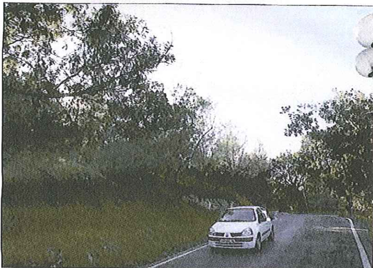
La vente de ce terrain constructible, sis 75, avenue Jean-de-Noailles, fait polémique.

Pour expliquer l'abstention de l'opposition divers-droite, Olivier Vasserot estime que « ce gel est un peu tardif. La Croix-des-Gardes a déjà été victime de densification.