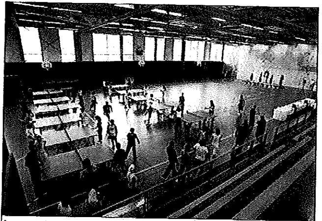
Le nouveau gymnase Capron servira aux collégiens en priorité, mais il accueillera également les associations sportives de Cannes hors temps scolaire.